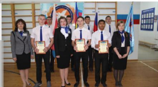
2, 3. День Конституции РФ