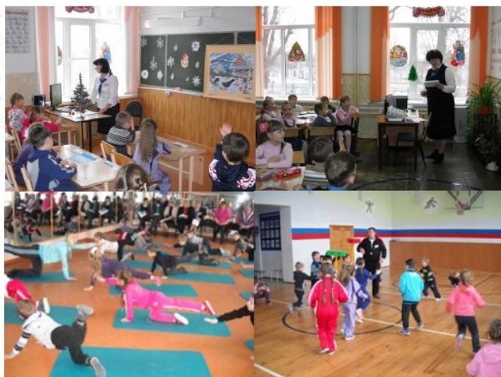
Фото: Семинар «Современные подходы к предшкольной подготовке»